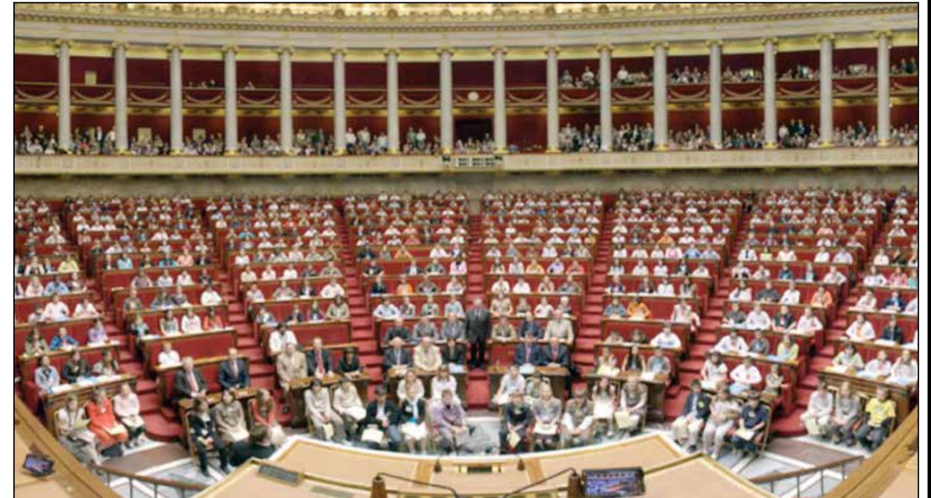
Bientôt des enfants à la place des parlementaires?

Vous ne le saviez peut-être pas, mais il existe aussi un Parlement des enfants. Il a été créé en 1994 par l'Assemblée nationale française en partenariat avec le ministère de l'Éducation nationale afin de permettre à des enfants de CM2 (équivalent à la